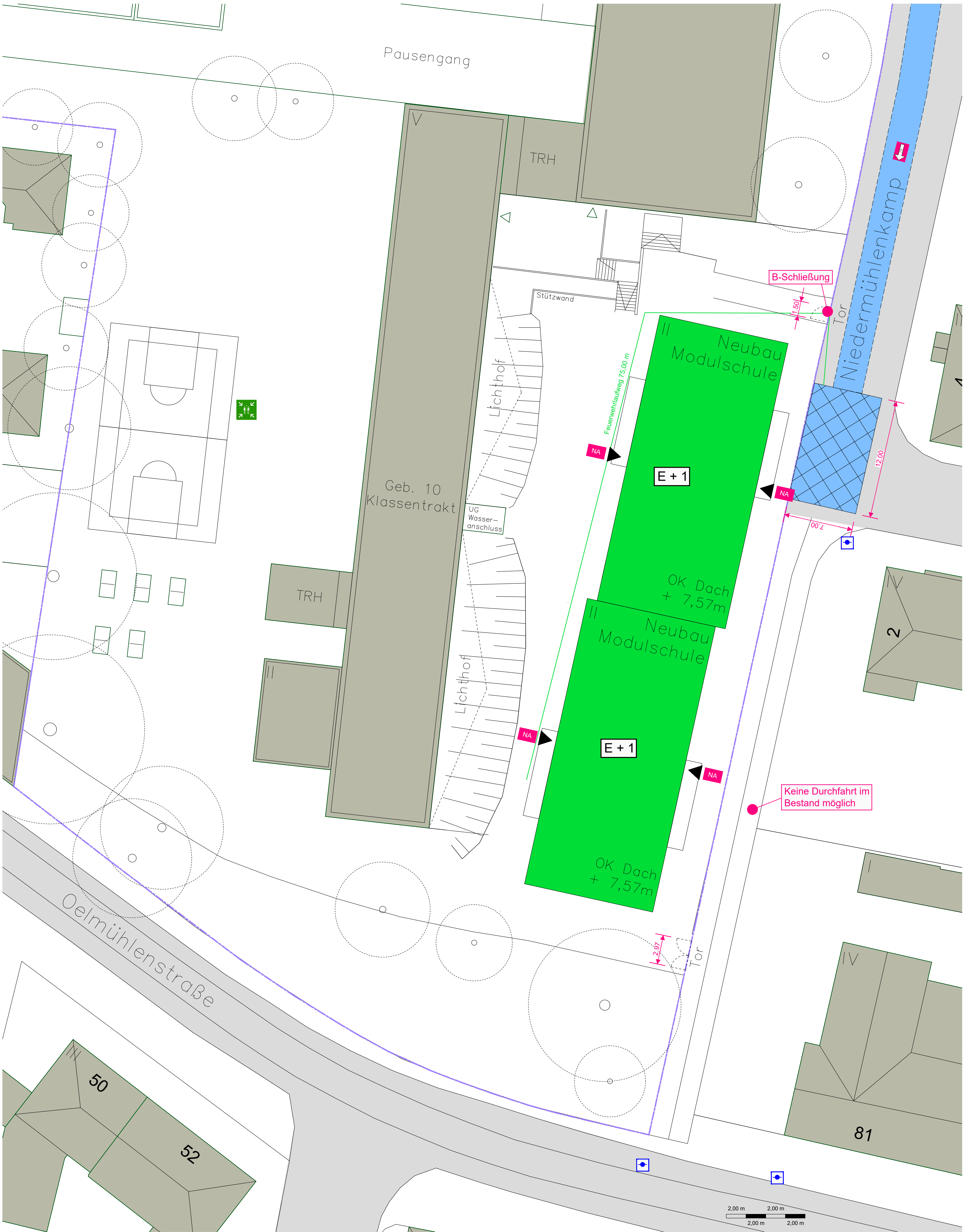
Flächen für die Feuerwehr Kurven in Zu- und Durchfahrten Prinzipielle Darstellung der Mindestabmessungen